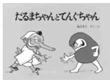
『だるまちゃんとてんぐちゃん』 1967年 福音館書店

おはなし、科学、あそびなど様々な分野の作品で愛されるかこさとしさんの創作は子どもたちに演じた手作りの紙芝居からはじまりました。幅広い世代に愛されるかこさんの作品をご紹介します。