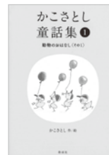
『かこさとし童話集①』 2023年 偕成社