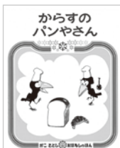
『からすのパンやさん』 1973年 偕成社