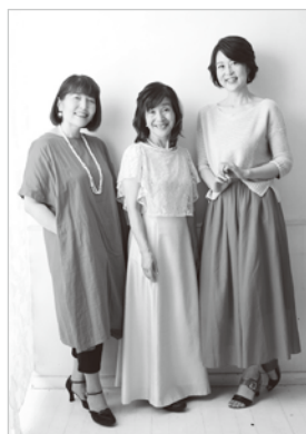
語りと音楽・花香

8月10日(土) 《鎌倉芸術館 小ホール》 14:00開演(13:30開場) ※90分、休憩あり