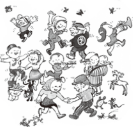
絵：かこさとし『わっしょいわっしょいぶんぶんぶん』(偕成社)