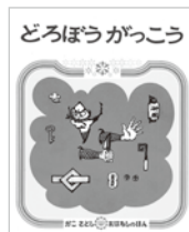
『どろぼうがっこう』 1973年 偕成社